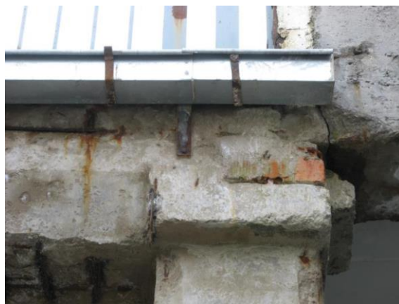
Poškození konstrukce na boku trámu v místě uložení