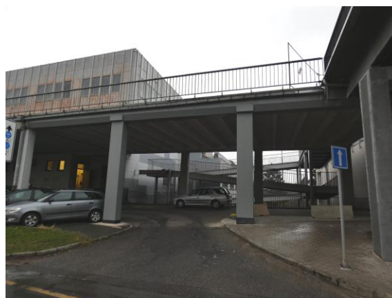
Stav konstrukcí po sanaci pohled