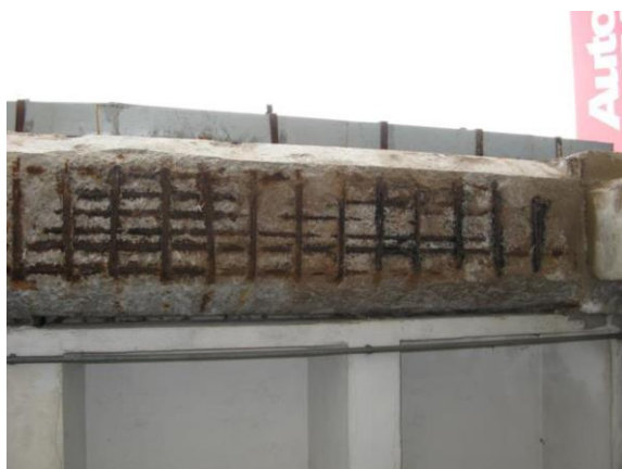
Koroze výztuže na spodním líci průvlaku