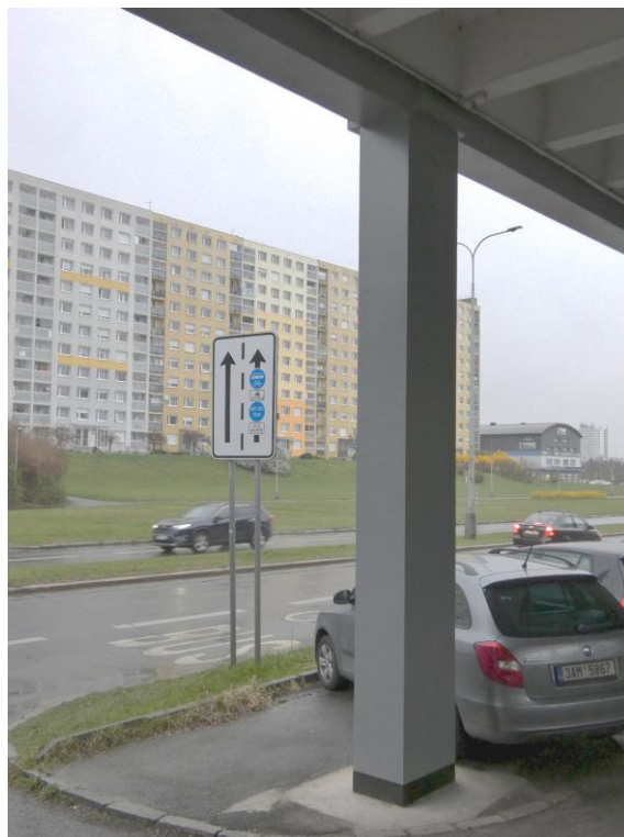
Opravené konstrukce sloupů včetně nátěru nad úrovní základů v patě sloupů