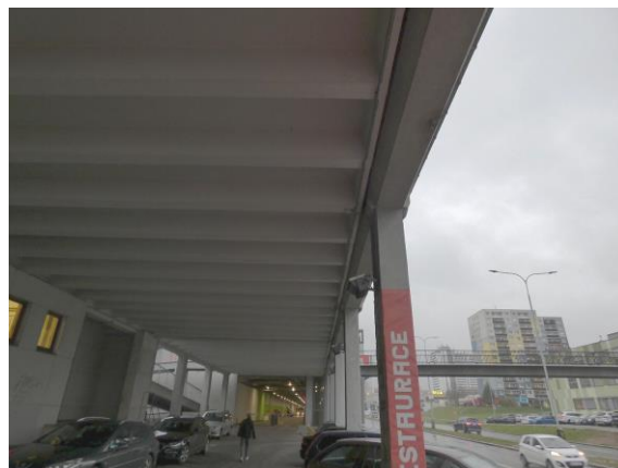
Stav opravených konstrukcí