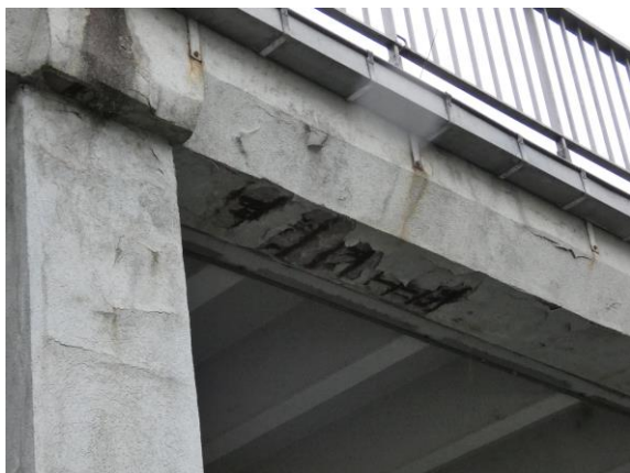
Průvlak poškozený na spodním líci