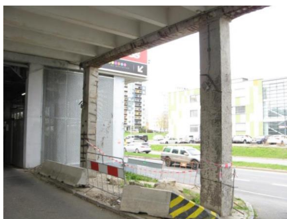
Stav konstrukcí sloupů a průvlaků před provedením sanačního zásahu