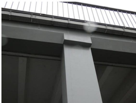
Sloup a průvlak po sanaci